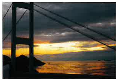
「瀬戸内の朝」井出祥治