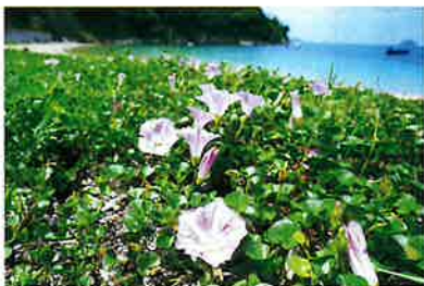
「鴨池海岸のハマヒルガオ」木原忠男